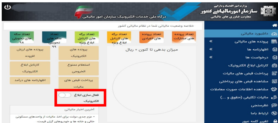
شکل شماره ۲