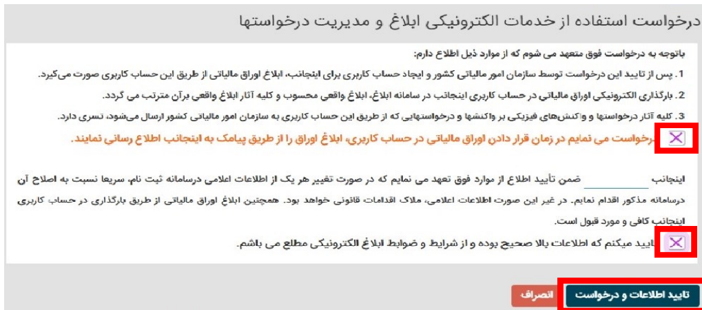
شکل شماره ۳

پس از کلیک بر روی دکمه "فعال سازی ابلاغ الکترونیک، (شکل شماره ۲)، برگه "درخواست استفاده خدمات الکترونیکی ابلاغ و مدیریت درخواستها" (شکل شماره ۳) برای شما باز می شود. با فشردن گزینه های ذیل و تایید آن، ابلاغ الکترونیک برای شما فعال شده و اوراق مالیاتی که از این تاریخ به بعد صادر می شوند در "کارتابل ابلاغ الکترونیک" (شکل شماره ۴) شما قرار خواهند گرفت.