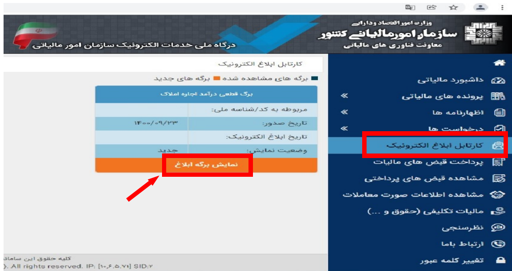
شکل شماره ۴

پس از فعال شدن خدمت ابلاغ الکترونیک، تمامی اوراق مالیاتی تشخیص/مطالبه، قطعی، دعوت به هیات های حل اختلاف مالیاتی و آراء هیات های مذکور، که در سامانه های سازمان امور مالیاتی کشور برای پرونده های مالیاتی عملکرد، ارزش افزوده، حقوق و تکلیفی و املاک اجاری شما صادر می شود (در آینده نزدیک، تمامی اوراق مالیاتی) به صورت خودکار بر روی حساب کاربری شما بارگذاری و همزمان پیامک اطلاع رسانی برای شما ارسال خواهد شد. در این مرحله از طرح ابلاغ الکترونیک شما ظرف یک هفته از تاریخ دریافت پیامک مذکور فرصت دارید تا جهت رویت اوراق خود به حساب کاربری مراجعه نمایید. پس از ورود به حساب کاربری، با کلیک بر روی "کارتابل ابلاغ الکترونیک"، می توانید لیست اوراق بارگذاری شده در حساب خود را مشاهده کرده و برگه مورد نظر خود را انتخاب کنید. چنانچه ظرف یک هفته به حساب کاربری خود مراجعه نکرده و برگه خود را مشاهده ننمایید، برگه از "کارتابل ابلاغ الکترونیک" خارج و برای شما قابل مشاهده نخواهد بود. در این صورت می بایست منتظر باشید تا برگه به روال دستی به شما ابلاغ شود. در این مرحله از طرح ابلاغ الکترونیک رویت برگه در حساب کاربری توسط شما در حکم ابلاغ محسوب می شود. بنابراین مهلت های قانونی شما برای واکنش به اوراق مالیاتی (ثبت اعتراض، تمکین، پرداخت مالیات و...) از تاریخ رویت برگه توسط شما آغاز می شود.